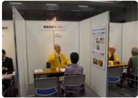
▲税理士・弁護士他、葬儀相談ブースでは、お客様一人ひとりに合わせたアドバイスをさせていただきました。