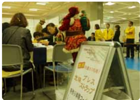
▲体験コーナーで、お気に入りの数珠づくりに挑戦。