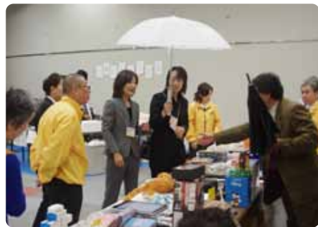
▲日曜品の雑多市や三陸わかめうどんなど物販コーナーも盛況でした。