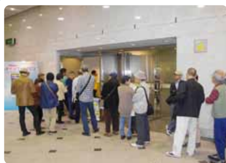
▲大勢のお客様が並ばれて、10時の開場をお待ちいただきました。