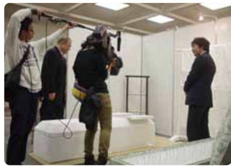
▲納棺体験。初めての体験におっかなびっくりの様子をMBS「Voice」で取材していただきました。