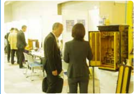
▲葬儀に関する様々な展示を興味深くご覧になっていました。