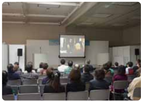
▲映画「エンディングノート」上映会。「終活を身近に感じた」「感動した」等の感想を頂戴しました。